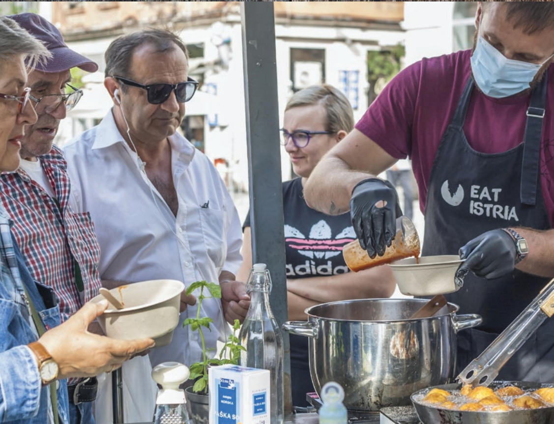
Fotografija s eko-gastro akcije "Hrana nije otpad" kojom je započelo prikupljanje recepata "za drugi dan".